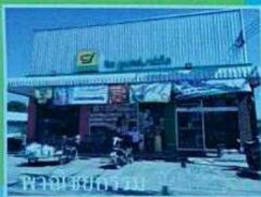
พาณิชย์กรรรม