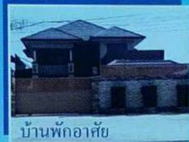
บ้านพักอาศัย