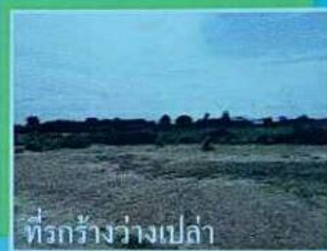
ที่รกร้างว่างเปล่า