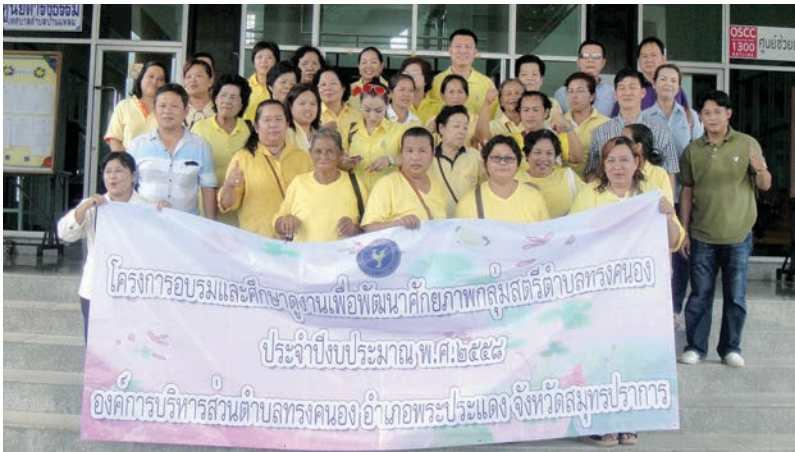
ANNUAL REPORT 2015 Banlaem Subdistrict Municipality