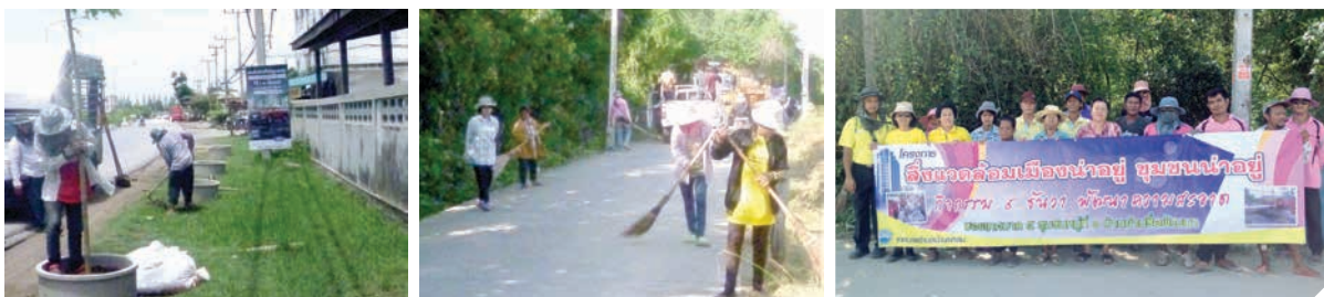
โครงการสิ่งแวดล้อมเมืองน่าอยู่ ชุมชนน่าอยู่