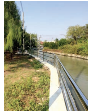
เสร็จแล้ว

โครงการก่อสร้างสะพานทางเดินเท้าข้ามคลองตลาด ระหว่างซอยเทศบาล 13/3 ถึงซอยเทศบาล 24 หมู่ที่ 4