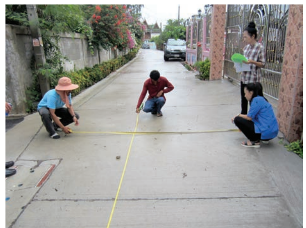
เสร็จแล้ว