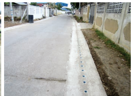
เสร็จแล้ว