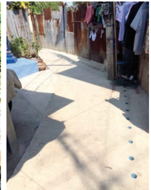
เสร็จแล้ว

โครงการก่อสร้างถนน ค.ส.ล. จากสะพานข้ามคลองตลาดเก่าถึงสุดซอย หมู่ที่ 3