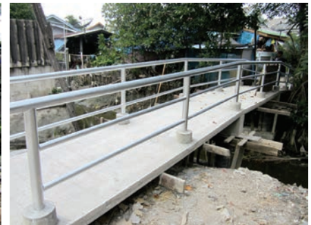
เสร็จแล้ว

โครงการปรับปรุงฝารางระบายน้ำ ค.ส.ล. บริเวณหน้าโบสถ์วัดลักษณาราม ตั้งคลองข้างโรงเรียนเทศบาลวัดลักษณาราม (สมุทรราชบุรีวิทยาการ) หมู่ที่ 7