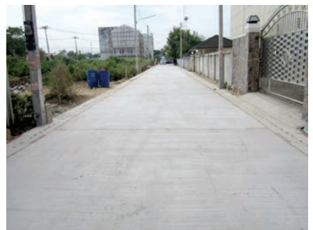
เสร็จแล้ว