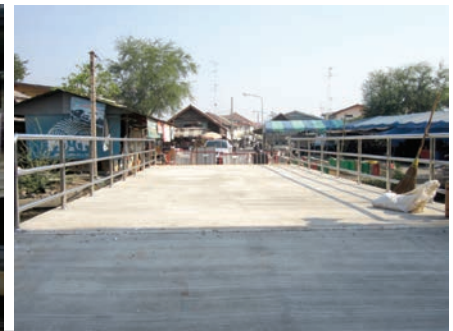
เสร็จแล้ว

โครงการปรับปรุงฝารางระบายน้ำ ค.ส.ล. ซอยเทศบาล 25 หมู่ที่ 4