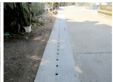
เสร็จแล้ว