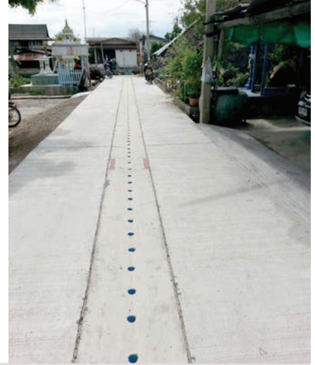
เสร็จแล้ว