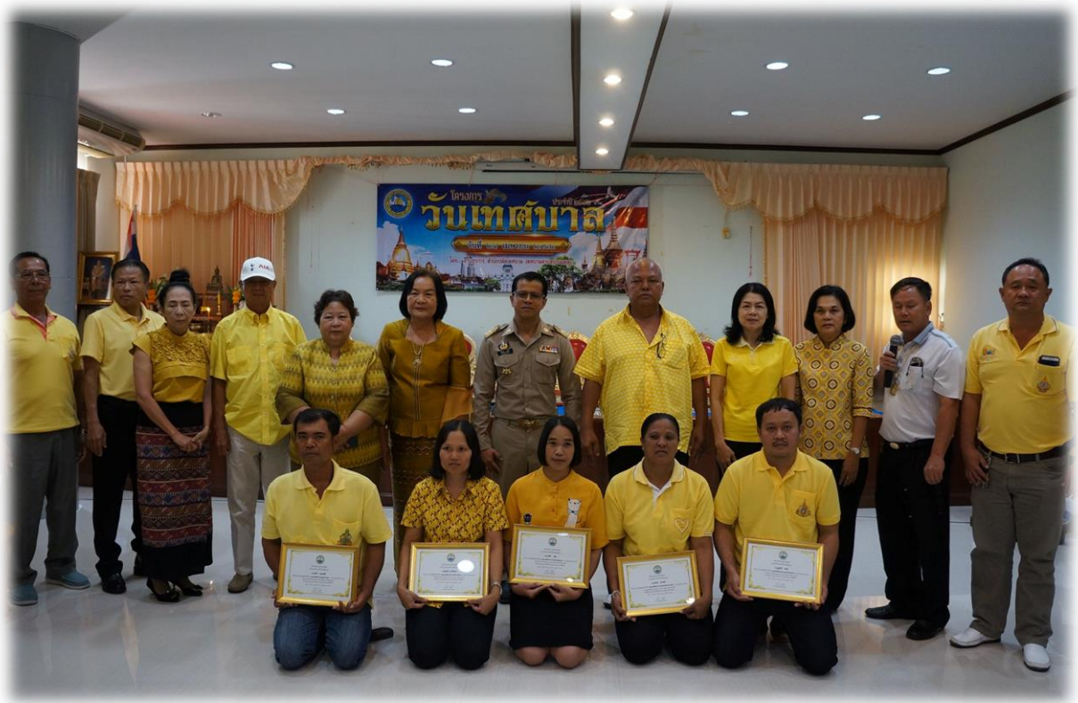
มอบรางวัลเชิดชูเกียรติบุคลากรเทศบาลดีเด่น